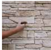
2 - J'élimine le surplus de colle