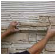
1 - Je pose en faisant baver la colle

Utilisez exclusivement les produits ORSOL, ils vous assurent un travail bien fait et vous offrent la garantie produit ORSOL. Ne jamais utiliser de produits à base d'acide pour la pose ou l'entretien.