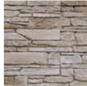
3 - J'hydrofuge

MATERIEL NECESSAIRE : Peigne 9x9x9, truelle, niveau, crayon, seau, malaxeur, colle ORFLEX, pulvérisateur et hydrofuge si pose en extérieur, mortier joint ORSOL.